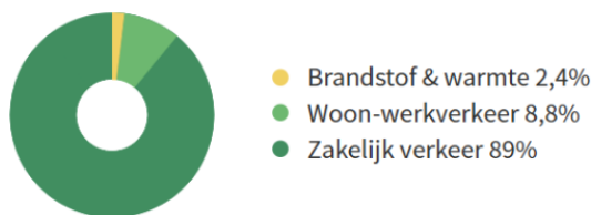
Figuur 2.1: verdeling CO 2 uitstoot